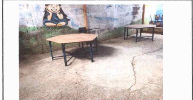
Foto 2: Piso de una de las aulas de preprimaria en muy malas condiciones.