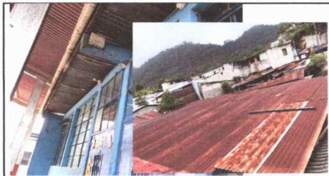
Foto 5: Techo en tres aulas en mal estado y goteo de agua en tiempos de lluvia.