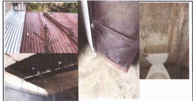
Foto 4: Techo y estructura de baños en general (sanitario, paredes pisos y puertas) en mal estado.