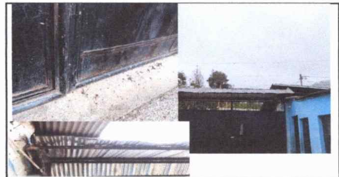
Foto 6: Porton en malas condiciones, techo con estructura débil y lamina en mal estado.

Observación: Si es necesario se pueden agregar hojas adicionales y actualizar el número de hojas.